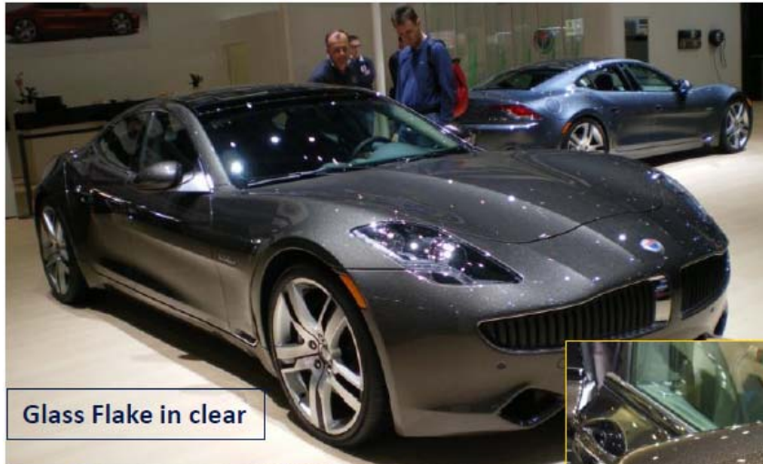
Glass Flake in clear