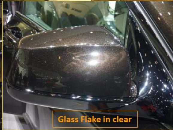
Glass Flake in clear